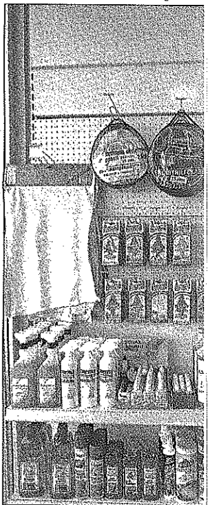
Vom A(bschleppseil) bis zur Z...

Gegenüber der Bank ist es wichtig, durch aktive Kommunikation und Vor-lage von aktuellen, aussagefähigen mo-natlichen betriebswirtschaftlichen Auswertungen am besten mit Geschäfts-analyse, Branchenvergleich und Analyse der Privatentnahmen und -einlagen das gegenseitige Vertrauensverhältnis wei-ter auszubauen. Mit einer guten Unter-nehmensorganisation lässt sich übrigens selbst die Höhe der Schuldzinsen besser verhandeln.