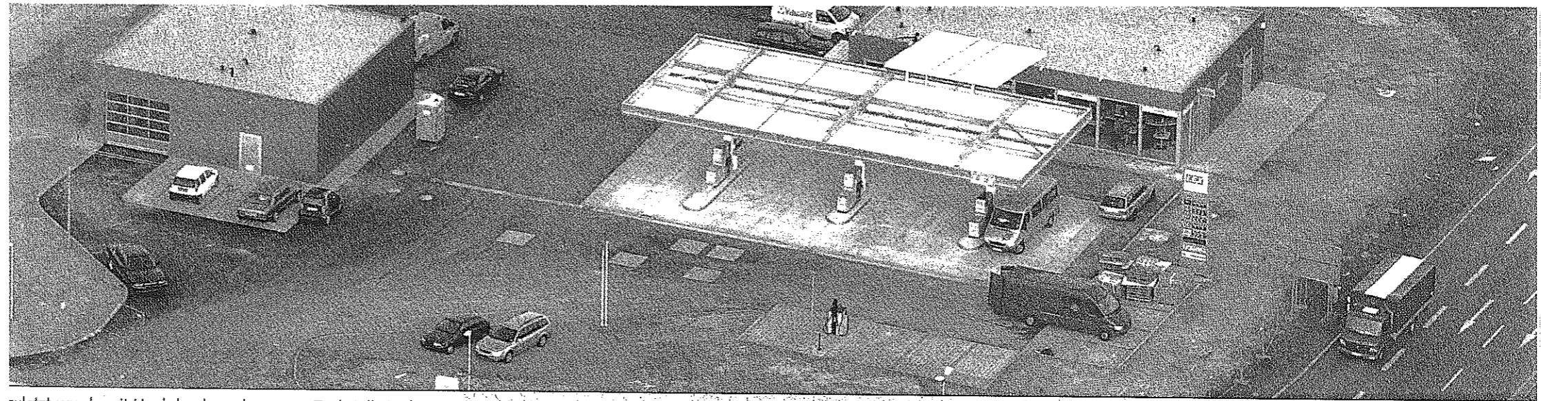
zuletzt wurde mit Hochdruck an der neuen Tankstelle in den Lerchenäckern gearbeitet. Die Tankstelle liegt direkt an der Bundesstraße 14.