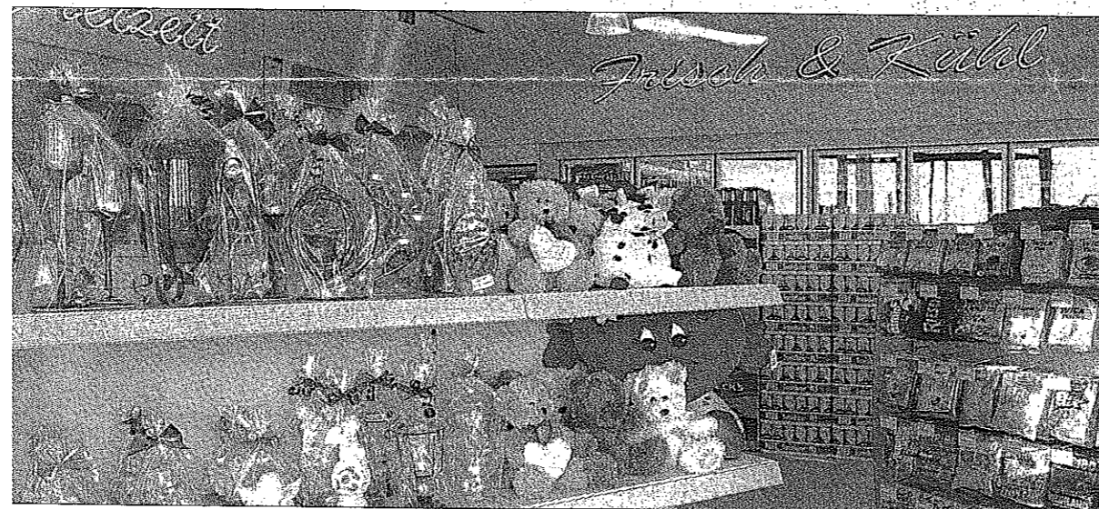
Last-Minute-Geschenk: Auch das ist im Tankstellenshop zu haben.